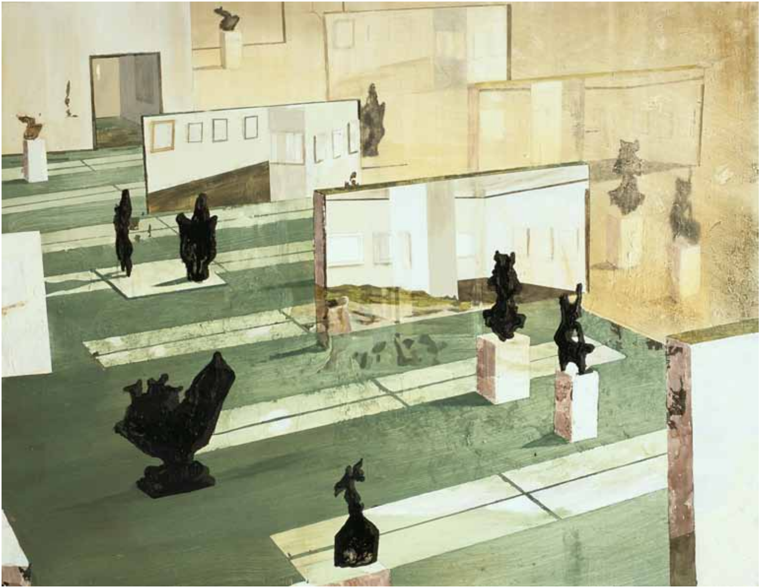
So Long Salong , Karin Mamma Andersson, 2004