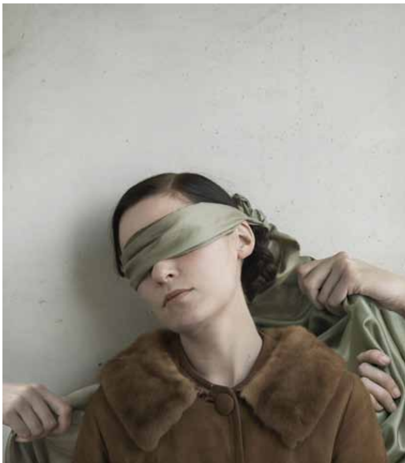
La Belle Indifférence , Lovisa Ringborg, 2011