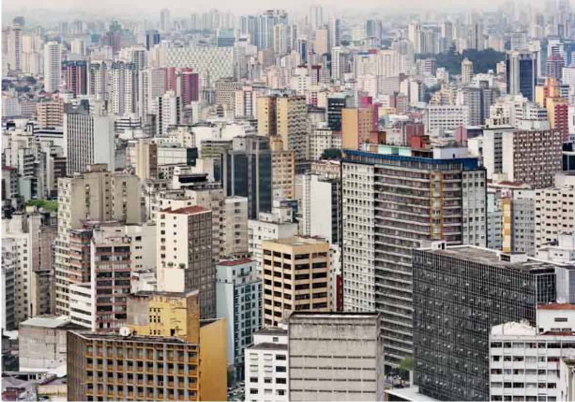
If You Love Global Warming - Honk!, # 4. São Paulo, Brasilien