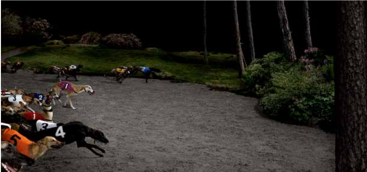
Hunting Ghosts , Lovisa Ringborg, 2009