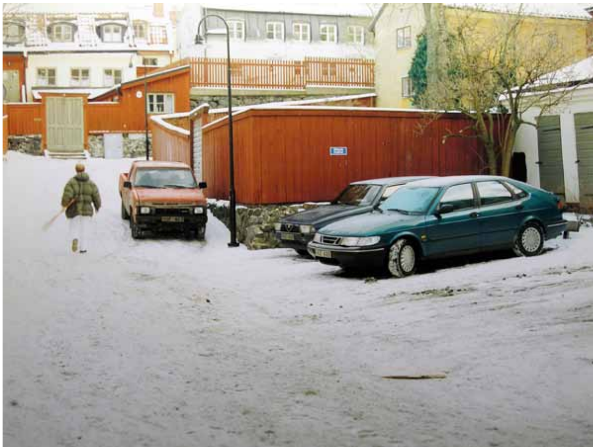
Ur serien Baseball, Magnus Ahnfeldt 1997