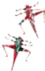
Tomas Bromée Cola Hopper (2 st) 11,5 cm Aluminiumburk