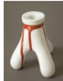
Anna Kraitz Fire h 13,5 cm Ljusstake i porslin