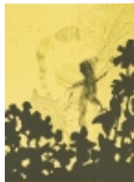
Per Enoksson Tyrann 57 x 40 cm Färgetsning