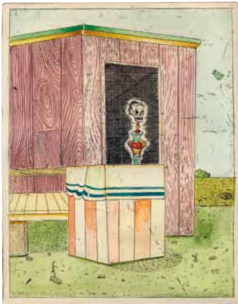
Natt i marknadstältet SAK-edition 2008 Etsning Upplaga 120 (varav 20 akvarellerade) Medlemspris: 1 800/8 000:-

Etsningen och de akvarellerade bladen presenteras på SAK:s galleri. Vernissage den 24:e april.