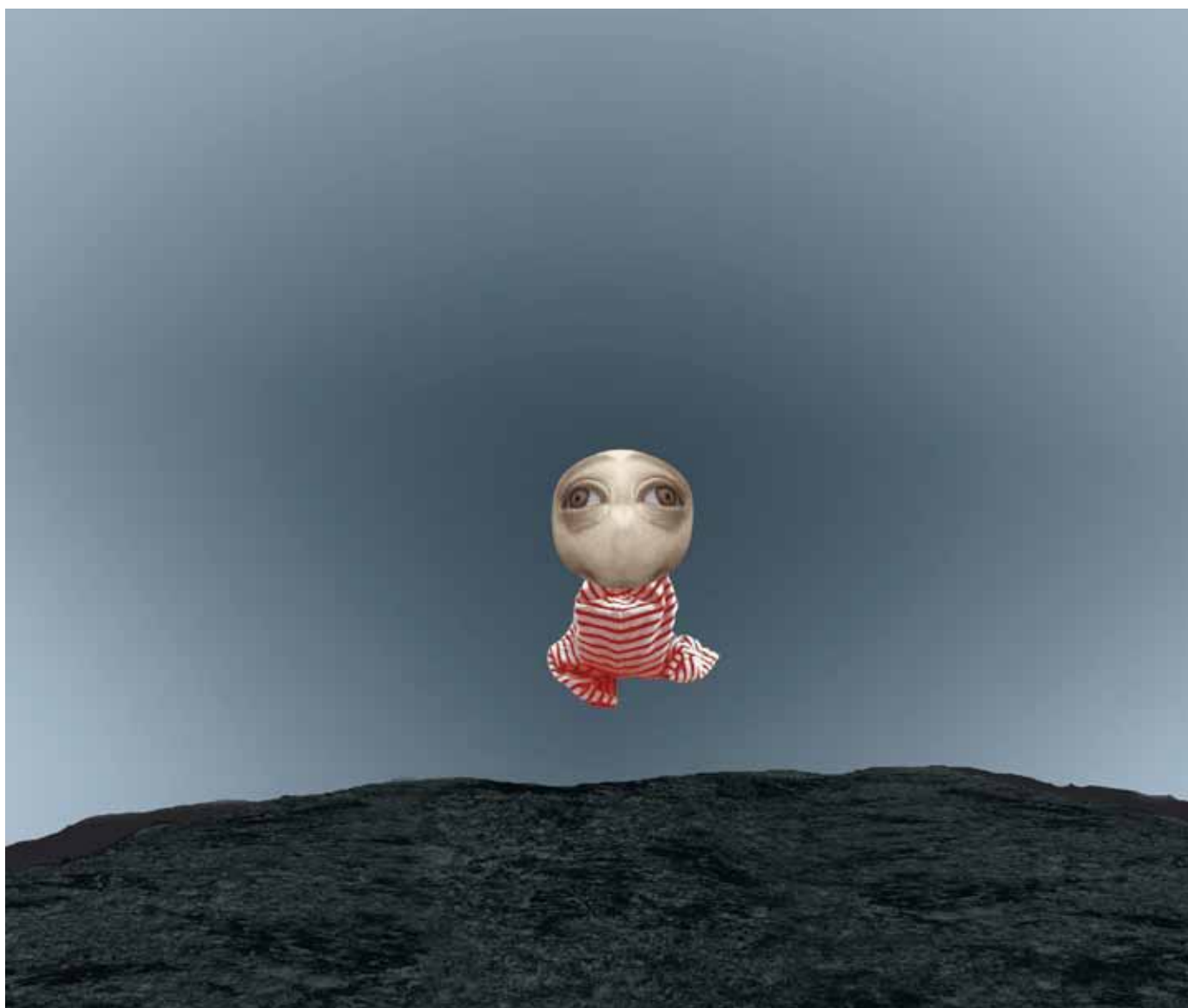
Alexandra Skarp Flyg , 2008 Gicléeprint 56 x 61 cm

Sveriges Allmänna Konstförening, Box 5343, 102 47 Stockholm Besöksadr: Liljevalchs konsthall, Djurgårdsvägen 60 Telefon 08-10 46 77. Postgiron: 1262-5. E-post: info@konstforeningen.se Hemsida: www.konstforeningen.se