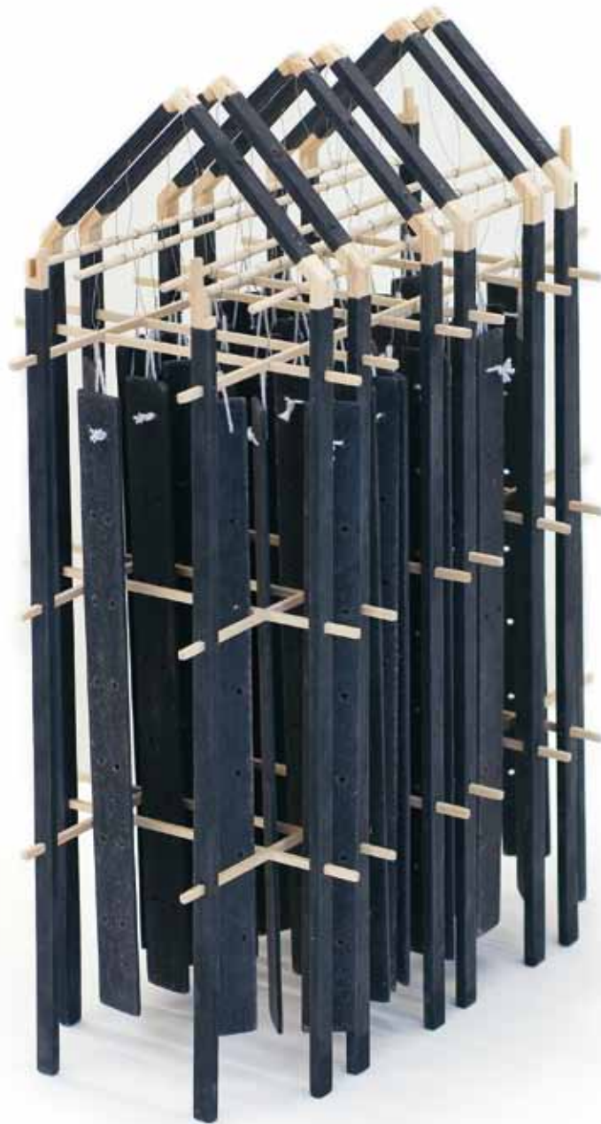
Lars Kleen Mingelin , 2008 Objekt, trä Höjd 46 cm