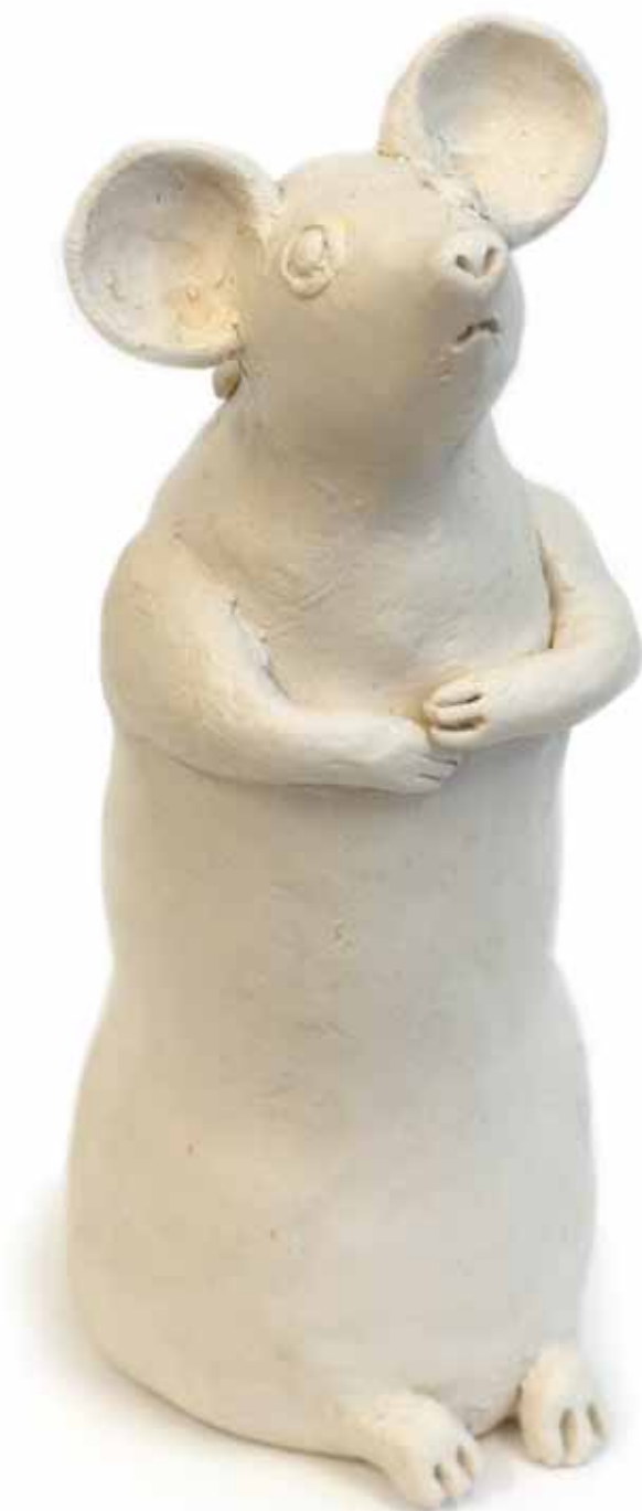
Amalia Årfelt Mus 2008 Bränd vit lera h 14 cm

Sveriges Allmänna Konstförening, Box 5343, 102 47 Stockholm Besöksadress: Liljevalchs konsthall, Djurgårdsvägen 60 Telefon: 08-10 46 77. Plusgironr: 1262-5 E-post: info@konstforeningen.se Hemsida: www.konstforeningen.se