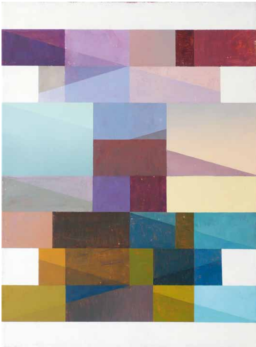
Jesper Nyrén Utan titel 2009 Olja och akryl på duk 38 x 28 cm

Jesper Nyrén (f. 1979) utforskar geometrins underbara värld. Oblygt kastar han sig in i måleriska domäner som sedan Malevitjs dagar i början av förra seklet varit associerade med teorier om upphöjdhet och renhet. Men Nyrén räds inte föregångarnas högstämda ambitioner; hans målningar kan snarare beskrivas som impressioner i en digital värld. Till det sköna konstruerandet adderar han en knivsudd blasfemisk orenhet och genast har verken förflyttats från dåtid till samtid.