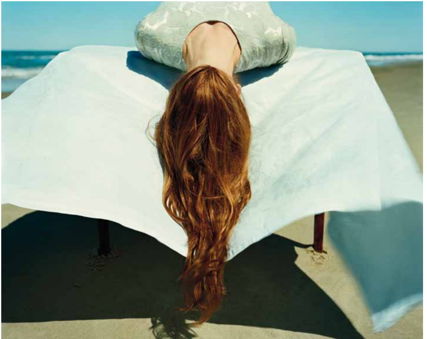
Denise Grünstein Head over Heels 2009 C-print 42 x 52 cm