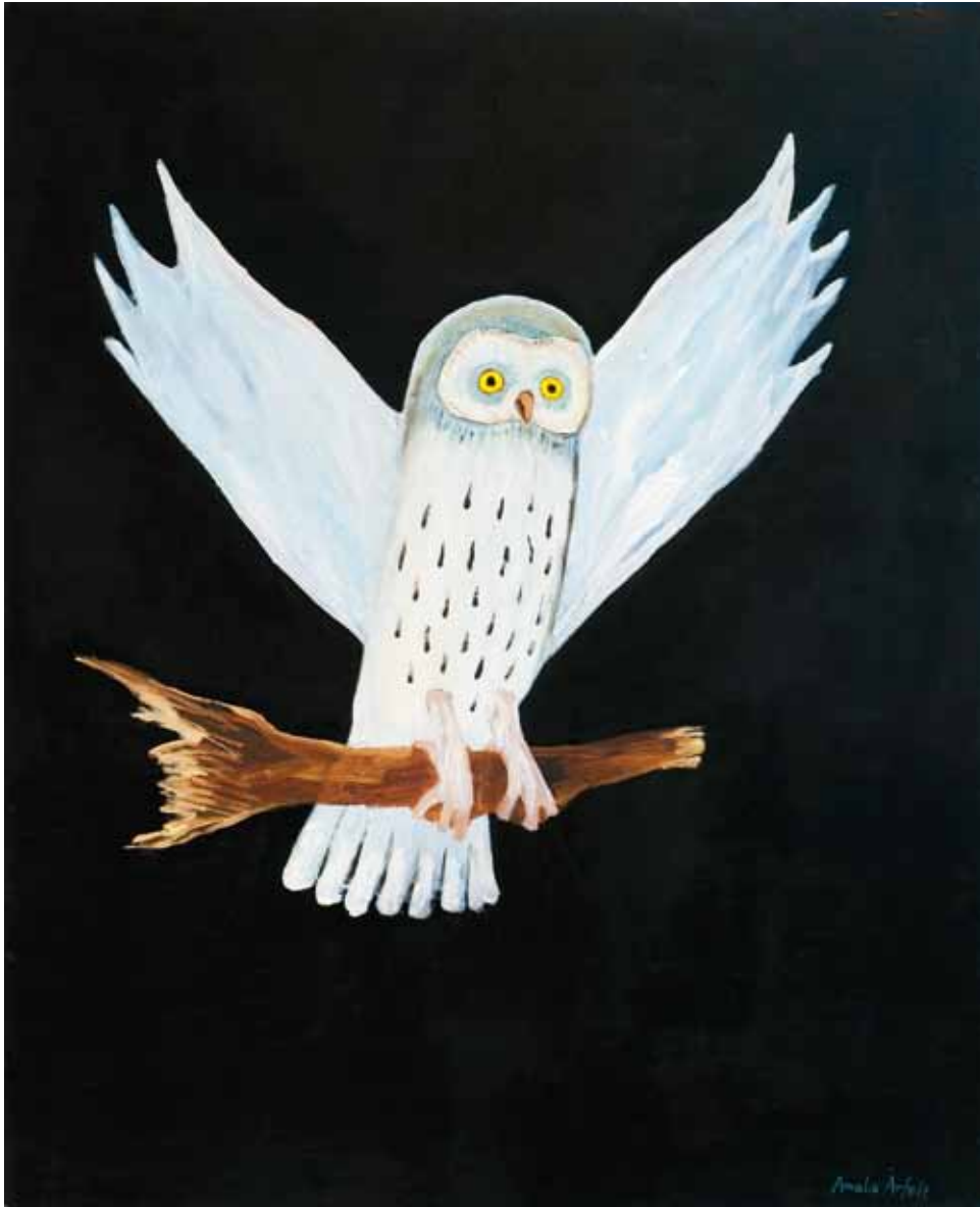
Amalia Årfelt Uggla med gren 2009 Olja på pannå 70 x 57 cm