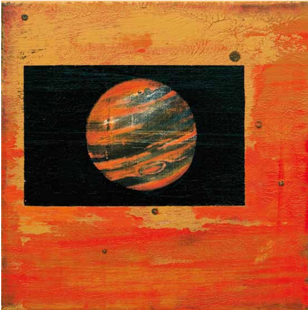
Karin Ögren Dagsverk-Jupiter 2010 Olja på duk 20 x 20 cm