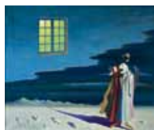
Waldemar Lorentzon, Ödesnatt, 1938, Mjellby Konstmuseum BUS2010.

SAK:s medlemmar hälsas hjärtligt välkomna till årsmöte.