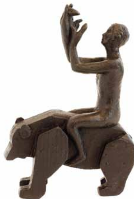
Bortbytingen av Tilda Lovell