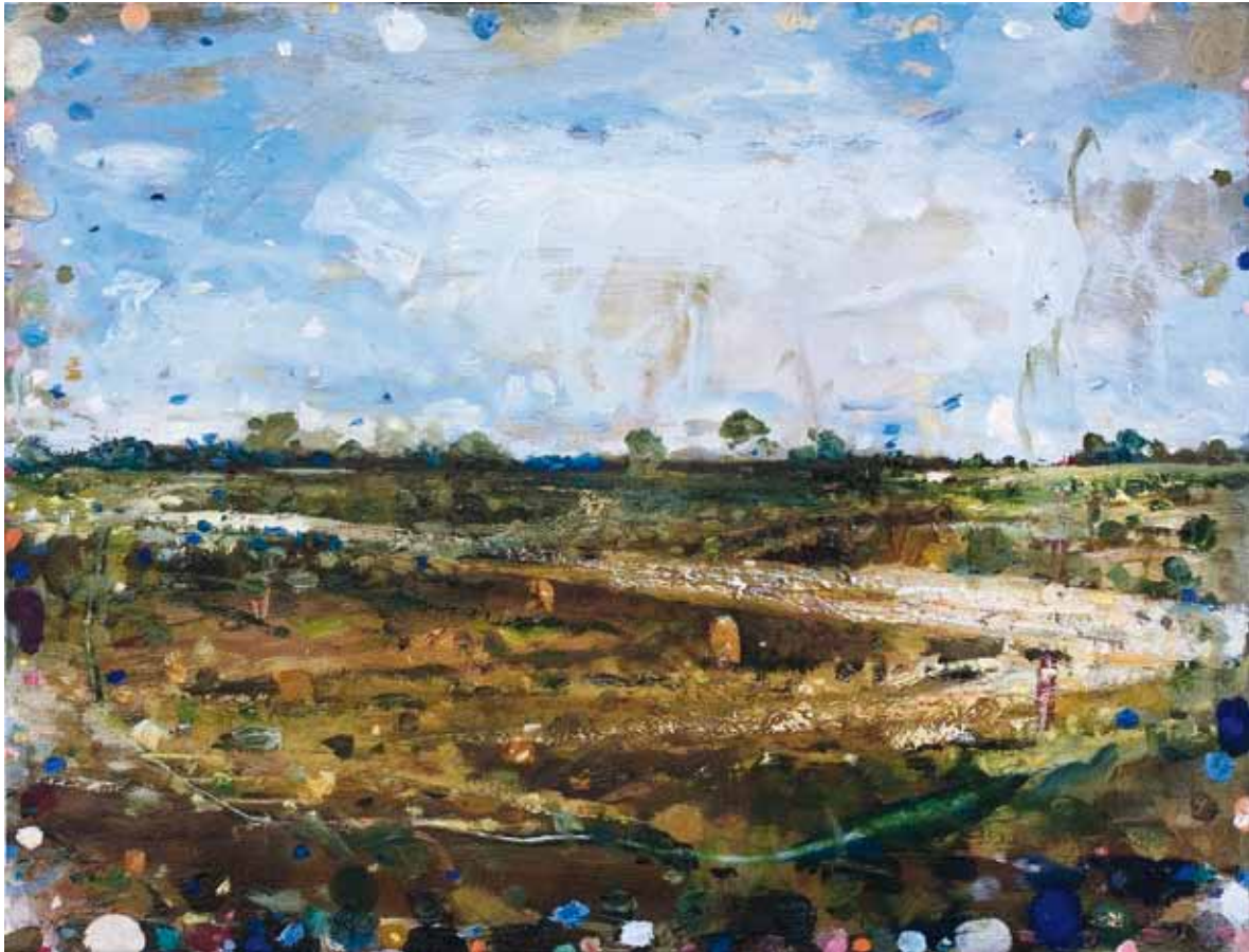
Thomas Edetun Nervös 2009 Olja på pannå 34 x 45 cm