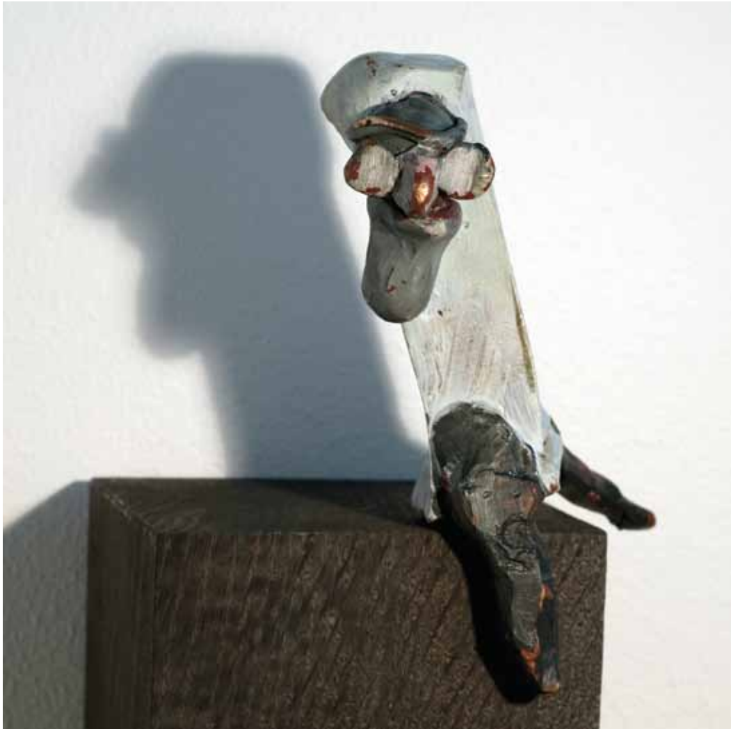
Claes Hake Såsom i en spegel 2007 Brons och trä 16 cm hög (100 cm inkl podium)