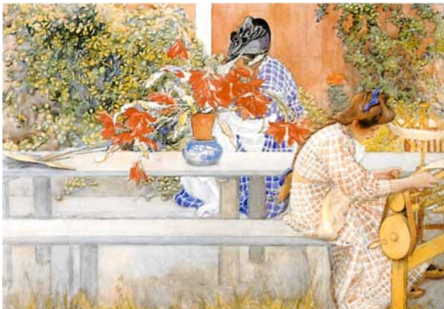
Kring Kaktusen Akvarell av Carl Larsson, 1909 SAK:s förstapris 1910