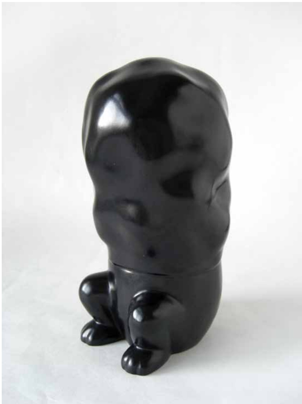
August Sörenson Transformation Brons 3/5 2008 Vinst 2011

Sveriges Allmänna Konstförening, Box 5343, 102 47 Stockholm Besöksadress: Liljevalchs konsthall, Djurgårdsvägen 60 Telefon: 08-10 46 77. Plusgiro: 1262-5 E-post: info@konstforeningen.se Hemsida: www.konstforeningen.se