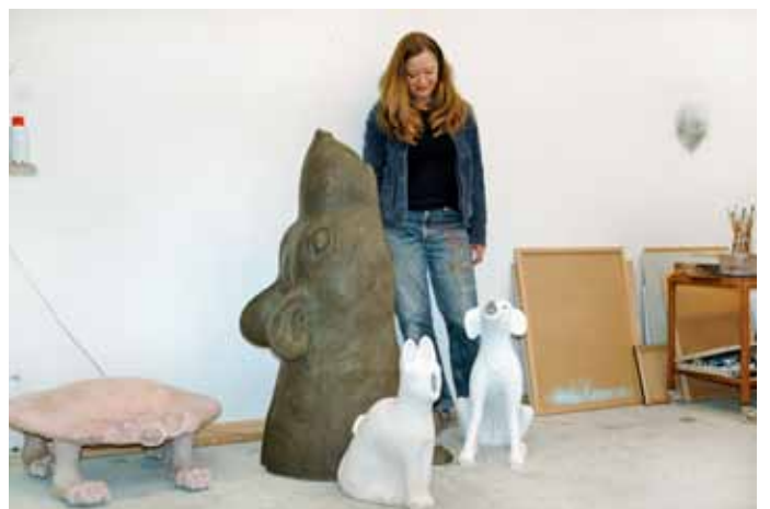
Ateljébild med Landkrabban som visades på Landsort, Rått huvud tänkt för Odenplan, en Hund och en Katt.