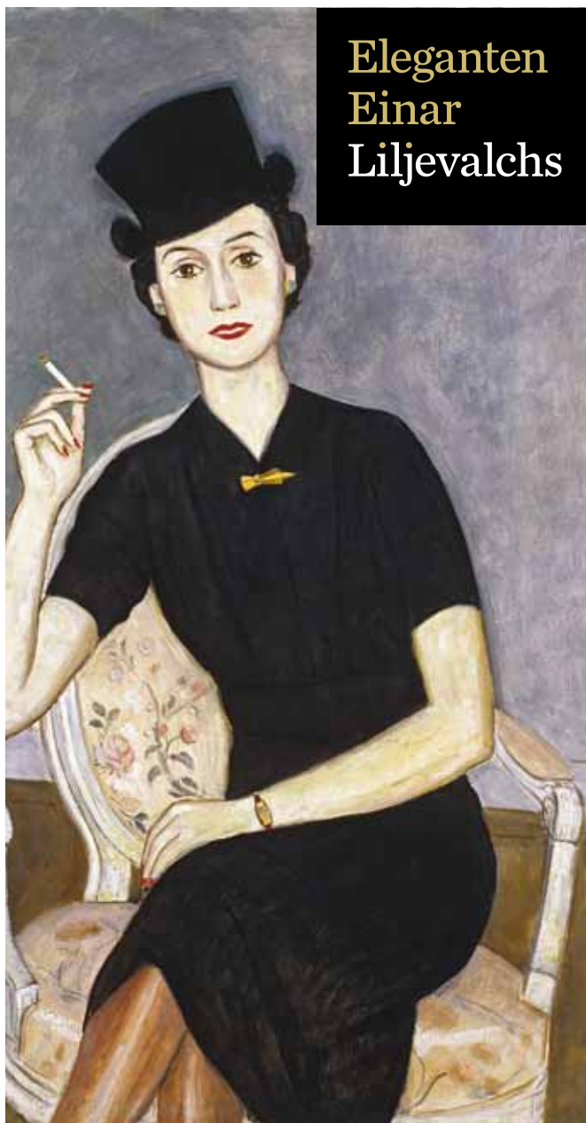
Dam i svart, 1937. Göteborgs konstmuseum. Bilden är besuren.

Posta kupongen till SAK, Box 5343, 102 47 Stockholm