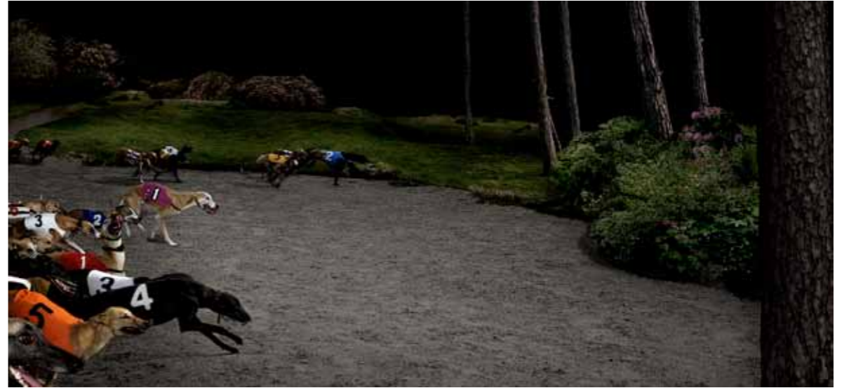
Hunting Ghosts, LovisaRingborg, 2009

– Jag kommer nog att stanna här ett tag nu, men jag kommer ändå försöka underhålla relationen till New York och mina vänner där, så jag vill helst åka dit ett par månader om året åtminstone. Det finns en otrolig energi där som jag älskar men nu måste jag fokusera på arbetet och jag har ibland svårt att hitta det lugn i New York som jag behöver.