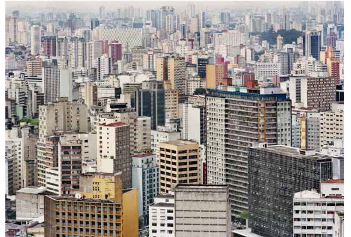
If You Love Global Warming - Honk!, # 4. São Paulo, Brasilien

– Jag har precis samma upplevelse av detta projekt som mitt förra riktigt stora projekt, Och himlen därövan ( Under the Shifting Skies ). För egen del tycker jag att det är roligt att producera böcker, men det som verkligen berör och engagerar publiken är utställningen. Det är där mötet och kommunikation uppstår. Det beror bland annat på att en utställning ser man till-