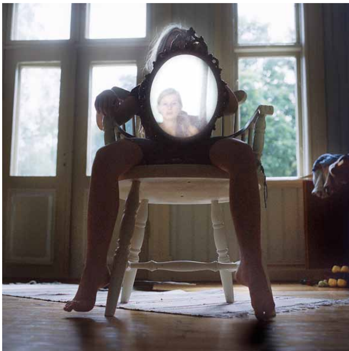
Vinst 2011 / Helga Härenstam, Photographing eachother, C print, 2008