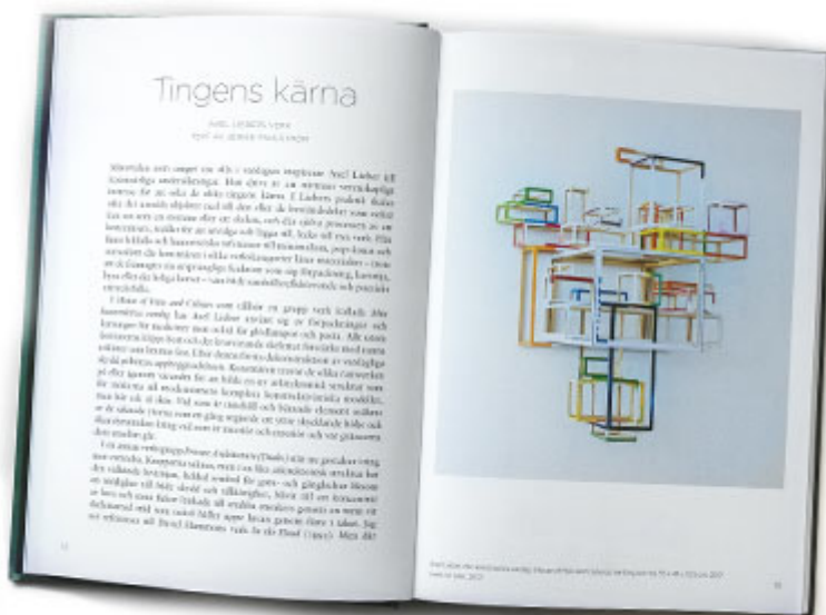
SAK:s årsbok 2017 – "Till konsten – tro, hopp, tvivel och kärlek". ISBN 978-91-7843-510-4