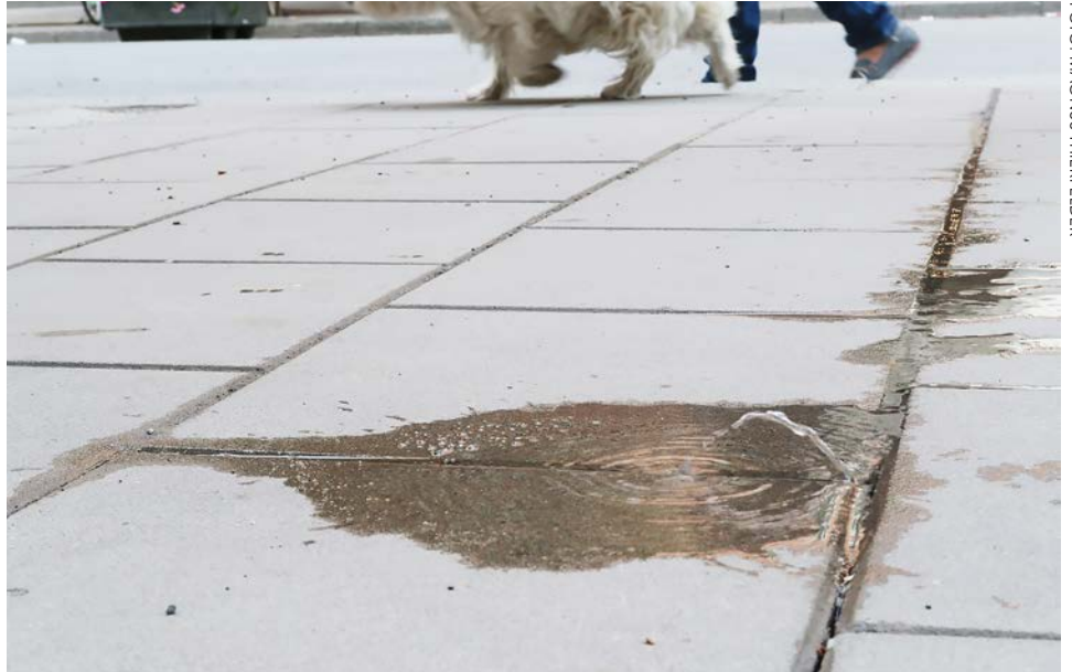
”Fountain”, (2004–2017), Swedenborgsgatan 1, Stockholm, 2017. Vatten, kopparrör.

Jag har som du nämner även gjort varianter på fontänen i andra skepnader och första gången var redan 2004 utanför ett galleri i London och sedan har jag gjort den inomhus men