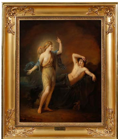
Per Wickenberg. "Iris och Morpheus", 1833.

"HAN SÅLDE VERK TILL DIGNITÄRER, TILL KUNGAHUSEN I FRANKRIKE OCH SVERIGE."