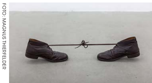
”Referring to thousands (indecisiveness and dis-sension)”, 2014. Skinnskor (storlek 42), blytyngder.