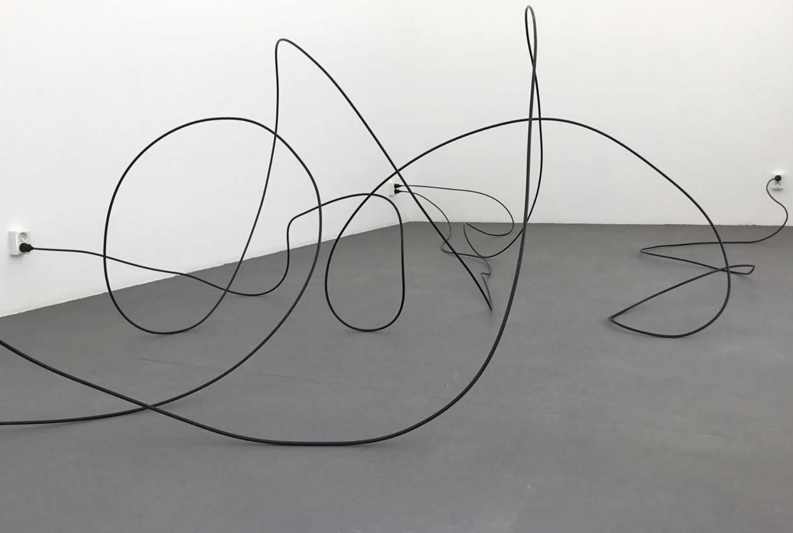
"A tension", 2006–2015, Elastic Gallery, Stockholm. Kabel, elkontakter, fjäderstål.

– Nej, inte direkt. Men jag har alltid haft ett varmt stöd från min familj som definitivt varit delaktig i att möjliggöra att jag kunnat ägna mig åt konsten. Och även om jag inte varit omgiven av kultur i bemärkelsen att jag hade tillgång till att se en massa utställningar och möta konstnärer så växte jag upp i en miljö som innehöll många olika kulturer som påverkade mig mycket. Det var viktigt.