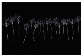
Nisrine Boukhari. "Landskap i ovissa tider", 2019.